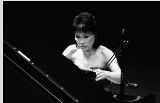
菅野由弘:「水の粒子」ピアノと明珍火箸のための