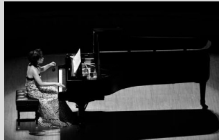
菅野由弘:「光の粒子」ピアノと南部鈴のための