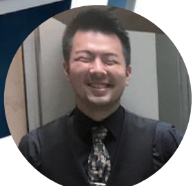
「アートピアノ」デザイン・ペイント：木村直人