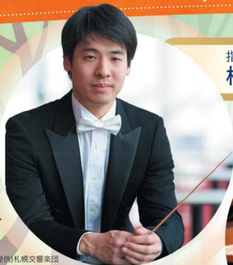
(提供)札幌交響楽団