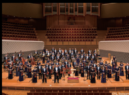
東京交響楽団 Tokyo Symphony Orchestra

1946年創立。2004年7月より、川崎市のフランチャイズオーケストラとしてミュゼ川崎シンフォニーホールを拠点に定期演奏会や特別演奏会を開催するほか、市内での音楽鑑賞教室や巡回公演、川崎フロンターレへの応援曲の提供など多岐にわたる活動を行う。これらが高く評価され、2013年に第42回川崎市文化賞を受賞。また、文部大臣賞、京都音楽賞、毎日芸術賞、サントリー音楽賞など日本の主要な音楽賞の殆どを受賞している。新国立劇場では1997年開館時からレギュラーオーケストラとして毎年オペラ・バレエ公演を担当。教育面でも「こども定期演奏会」「0歳からのオーケストラ」が注目されている。海外公演も多く、これまでに58都市で78公演を行ってきた。音楽監督：ジョナサン・ノット。公式サイト http://tokyosymphony.jp/